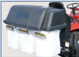
グラスキャッチャー (袋タイプ)