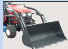
スーパーミニローダー