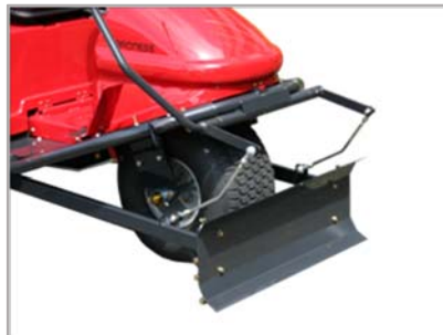
・GR165TSには排土板が付きます。