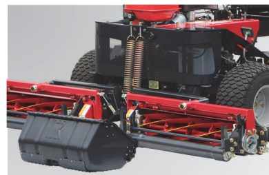
モアユニットは実績のある『LM185シリーズ』と共用です。グラスキャッチャーはオプションで取り付け可能です。