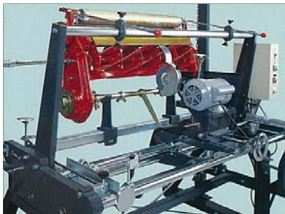
・本体のままリール研磨