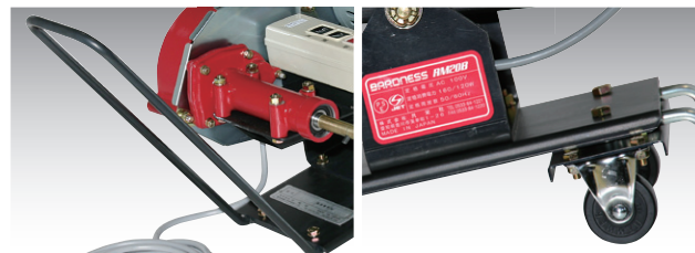
持ち運びに便利なハンドルと、移動に便利な車輪付きです。