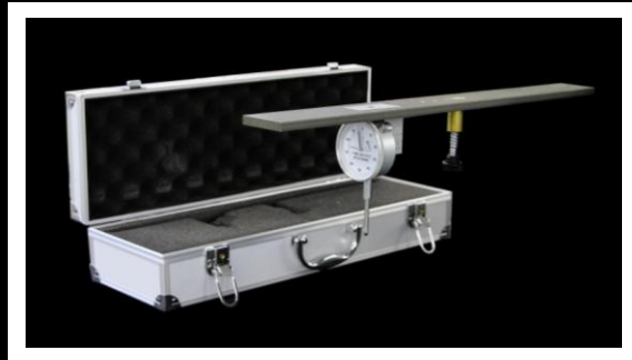
007M-HF1-AC : アナログ式グルーマーゲージ