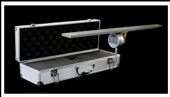
001-18D-HF1-AC : デジタル式刈高ゲージ